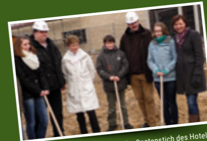
Februar 2011: Familie Rulle beim Spatenstich des Hotels.

Das Brauhaus Stephanus bietet alles, was Sie von einer Gasthausbrauerei erwarten; die typisch-westfälische Gastlichkeit, eine große Auswahl an kulinarischen Köstlichkeiten und - ganz exklusiv bei uns - das stets frische Stephanus Bräu in verschiedenen, ganz individuellen Sorten.